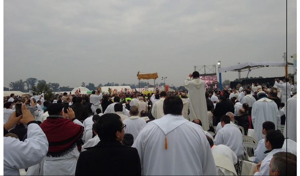
Al paso del Santísimo Sacramento immortalizan el momento.