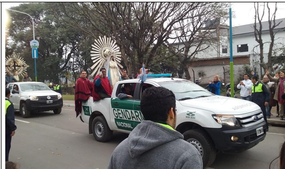
Al término de la Misa de Clausura del XI CEN Las imágenes de Salta de regreso