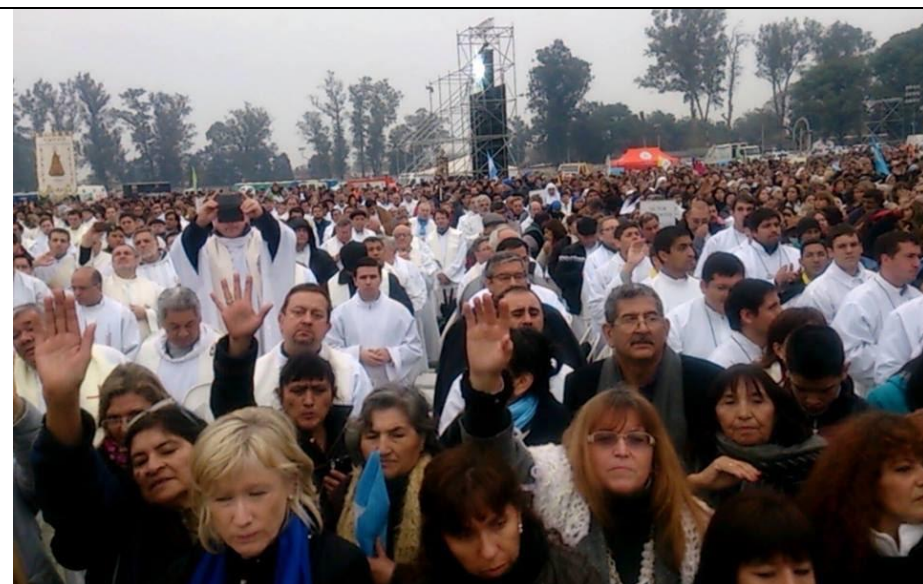
Procesión – la gente extiende su brazo