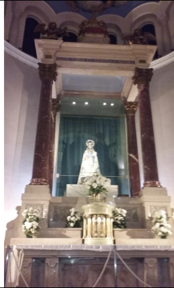
Iglesia N.S.de la Merced – altar principal