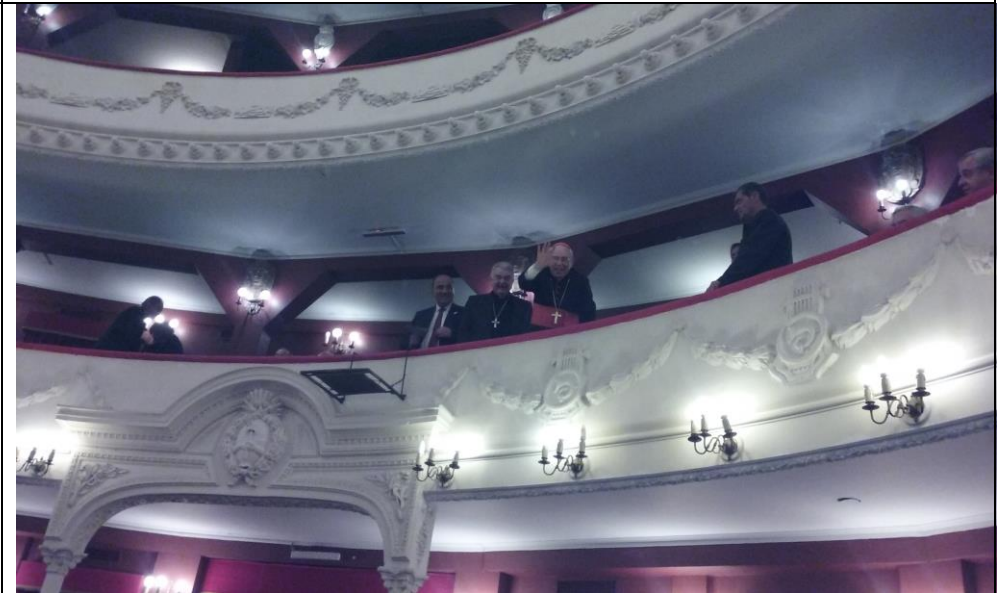
Teatro Alberdi – El Cardenal Re junto al Nuncio