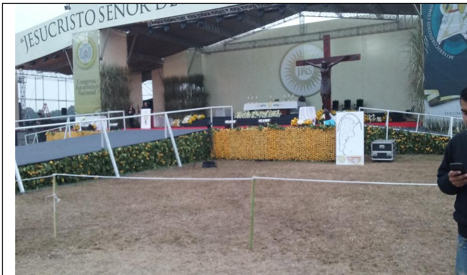
Adorno de la plataforma del altar con naranjas