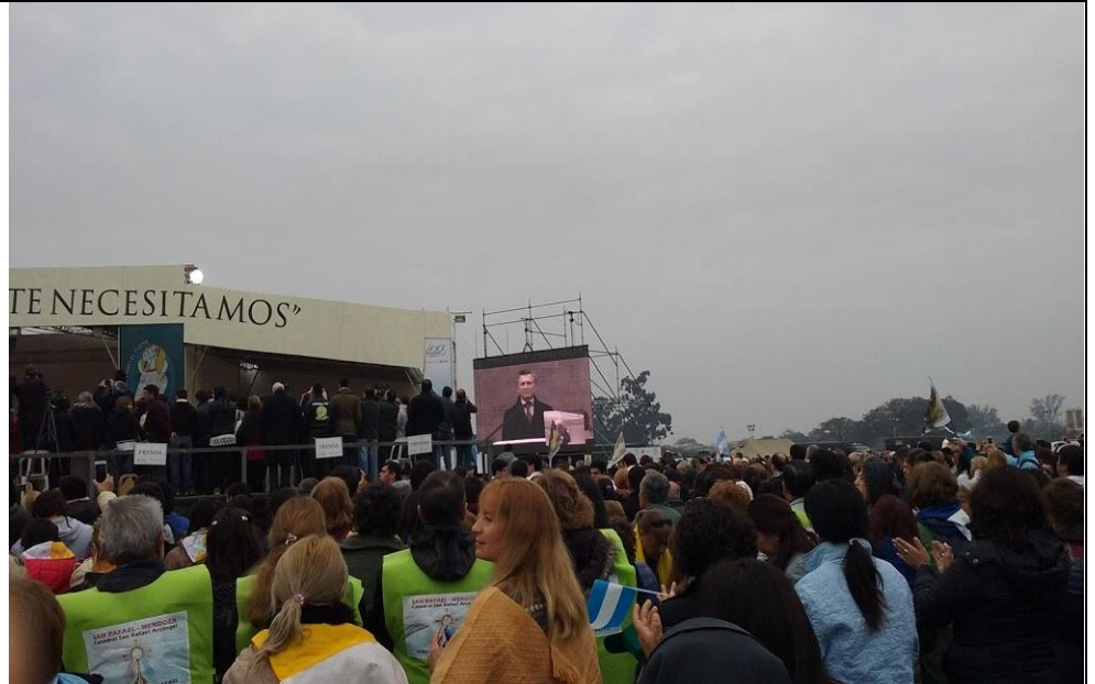
El Presidente llegó con el Cardenal Re Hacia el final de la Misa elevó una oración