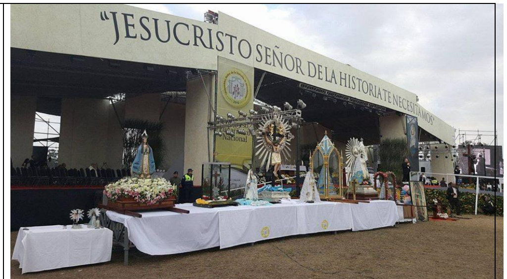
Imágenes devociones del NOA - el domingo la V.de Luján