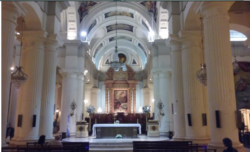
Catedral de Tucumán

Además, hay obras de Ballester Peña realizadas para una capilla en desuso por inundación; ornamentos de obispos; sagrario de madera tallada; y muchas cosas más.