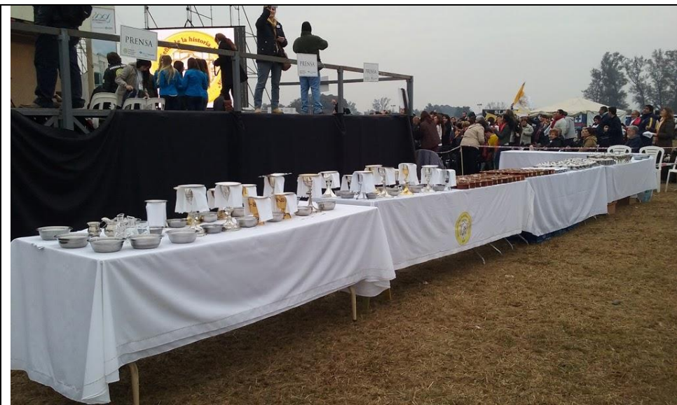
La mesa preparada para la consagración y comunión