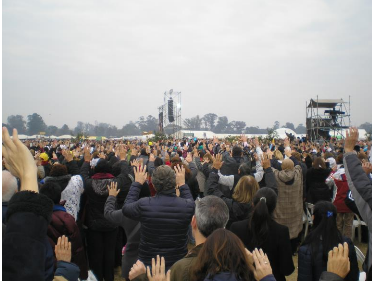
Al paso del Santísimo la gente lo sigue con fervor