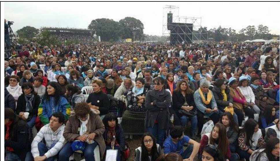
Misa Domingo presidida por el Legado de Papa Francisco – El Cardenal Ré predicó desde el ambón, como el Papa.