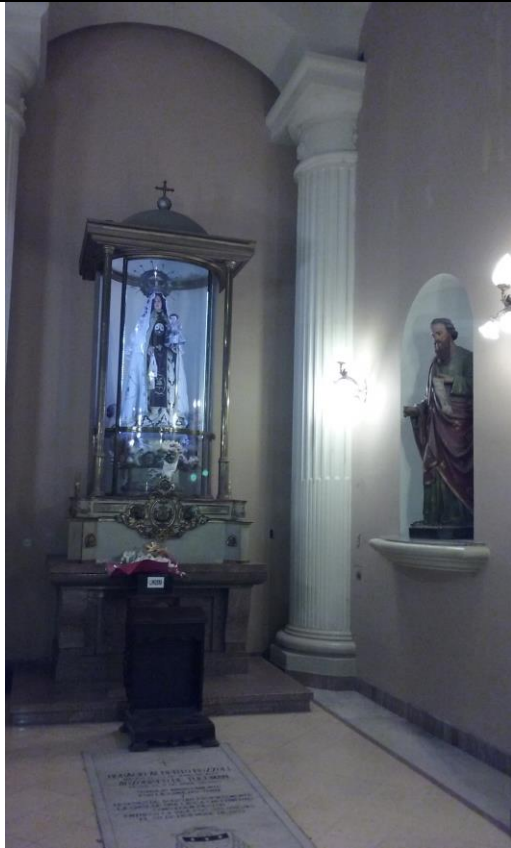
Catedral - Capilla lateral Virgen del Carmen y S.José