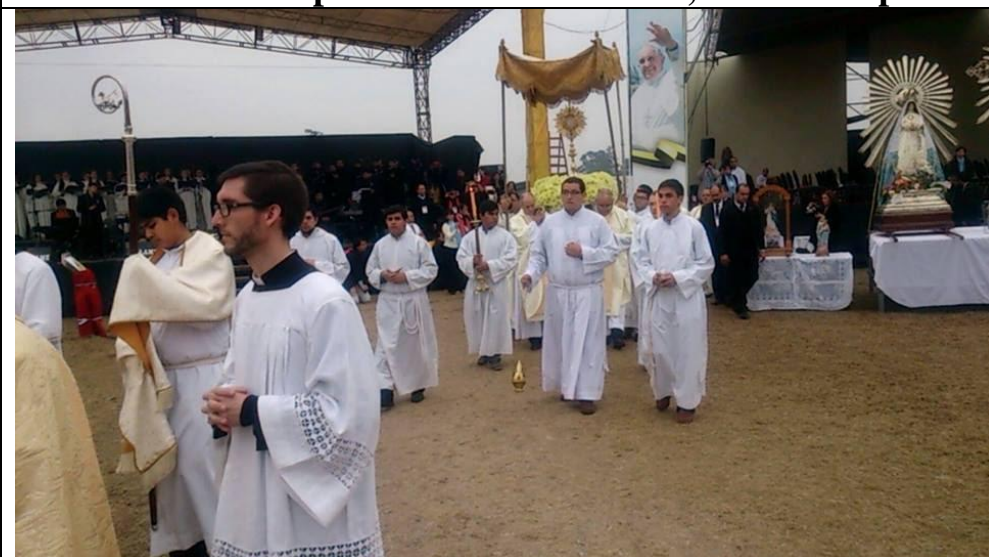
Procesión con el Santísimo Sacramento