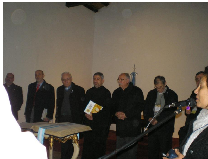
Recitación del Preámbulo de la Constitución Nacional seguida de la entonación del Himno Nacional Argentino.