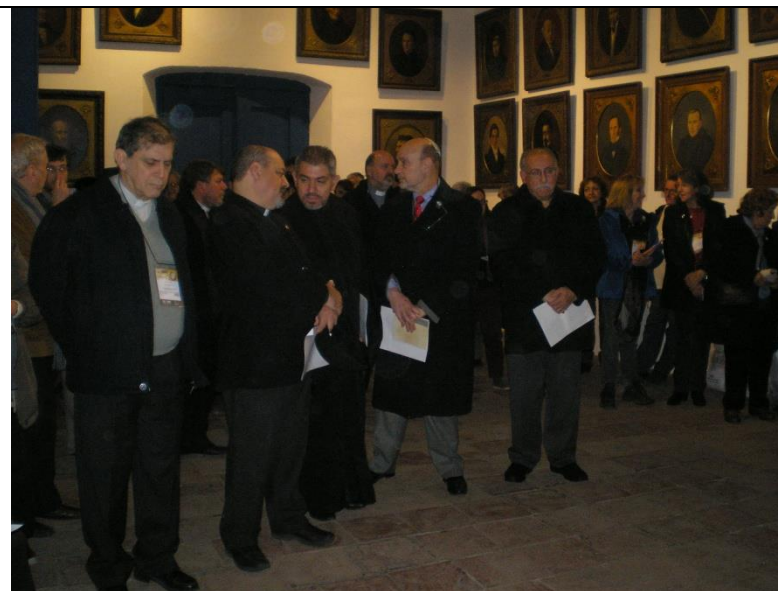
Ministros religiosos, Delegados de Ecumenismo y Diálogo Interreligioso de Diócesis y Movimientos