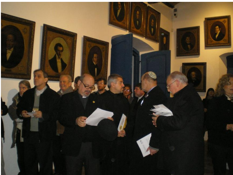
Salón de la Jura de la Independencia