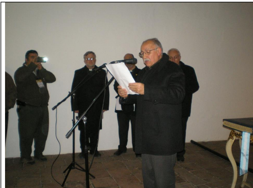
Momento de la elevación de plegarias de los ministros de diferentes confesiones y credos “estando juntos”. Ora el representante musulmán